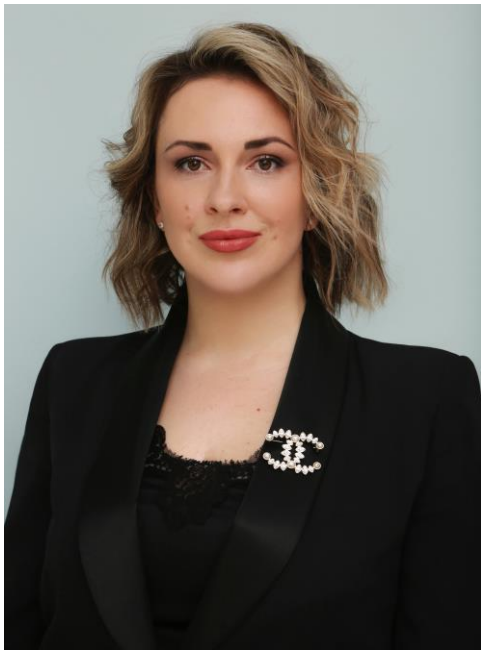
Председатель Комитета Яна Кудашкина