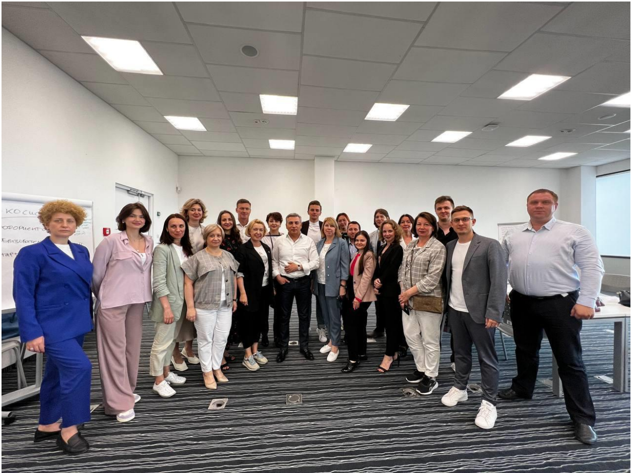
Встреча с Правительством Республики Чувашия по вопросу развития предпринимательства 01 июля 2022, г. Чебоксары